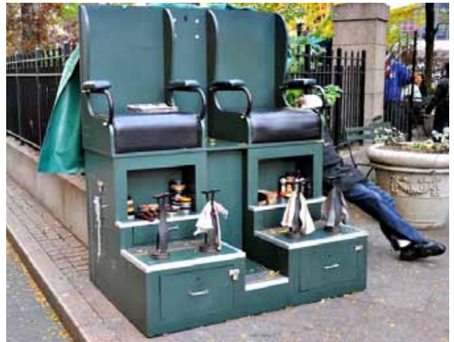
Nowy Jork biedny...