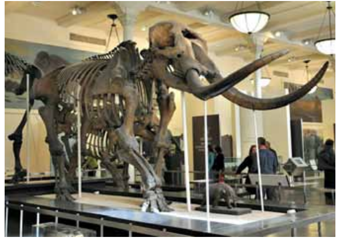
Nowy Jork „Przyjaciół”. Czy to tu, w Amerykańskim Muzeum Historii Naturalnej, pracował Ross?

Bogaci amerykańcy wykupują od naszych rodaków całe parcele, a Polacy przenoszą się do tańszych dzielnic. Oueens to wyjątkowo spokojna dzielnica - żadnych gangsterów, a także policjantów (co ciekawe, bardzo przyjaznych, zawsze chętnych do pomocy), w hotelu zaś pracują sami Hindusi. Cenami kuszą sklepy z elektroniką. Szczególnie atrakcyjny by ten, prowadzony przez ortodoksyjnych Żydów. Doskonale zorganizowany sklep. To tej pory otrzymujemy z tego sklepu katalogi.