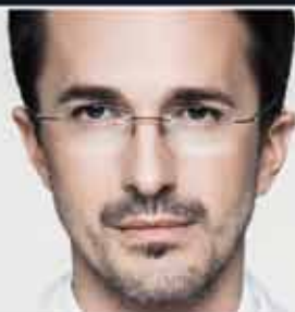
DOKTORANT Z WYBORU