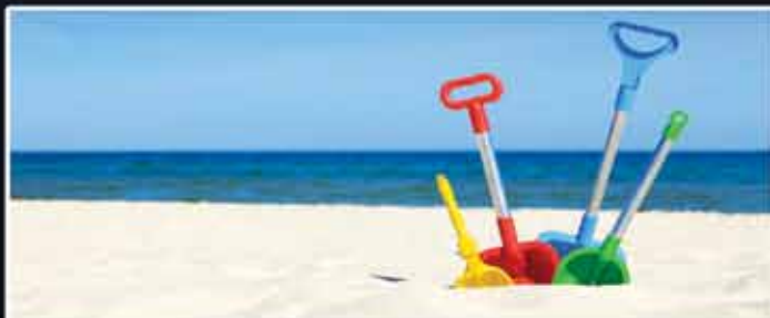
GDZIE NA WAKACJE? OTO JEST PYTANIE!