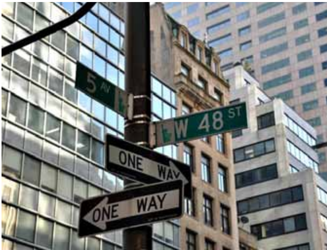
Nowy Jork, w którym każdy ma prawo mieć rację. Przy najmniej swoją własną...

Agnieszka Walczak-Beszczynska Więcej zdjęć można obejrzeć na: http://leszekbeszczynski.blogspot.com/